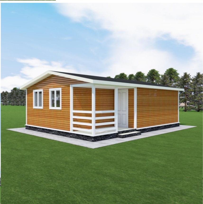
1-й этаж (4)